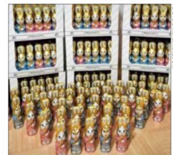
750 Osterhasen warten auf ihre neuen Besitzer.

▶ Weitere Infos unter www.diehilfemacher.de . Spendenkonto: IBAN DE03 6805 0101 0013 2479 60. Spenden und Beiträge werden steuerlich anerkannt.